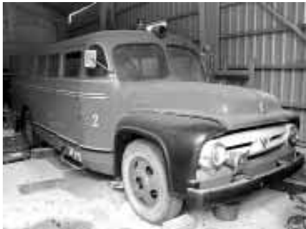
Paloauto Ford F 600 / 1953 Hienokuntoinen

Tiedustelut/tarjoukset: Risto Ylä-Kapee, Terälahti p. 050 547 4410 tai (03) 378 140